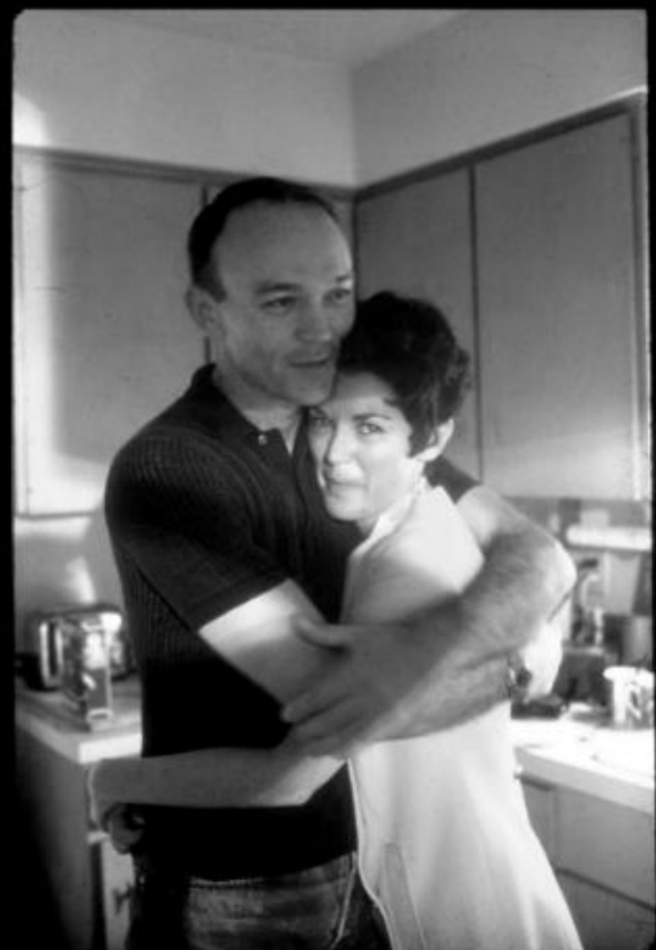
Michael Collins October 31, 1930 – April 28, 2021